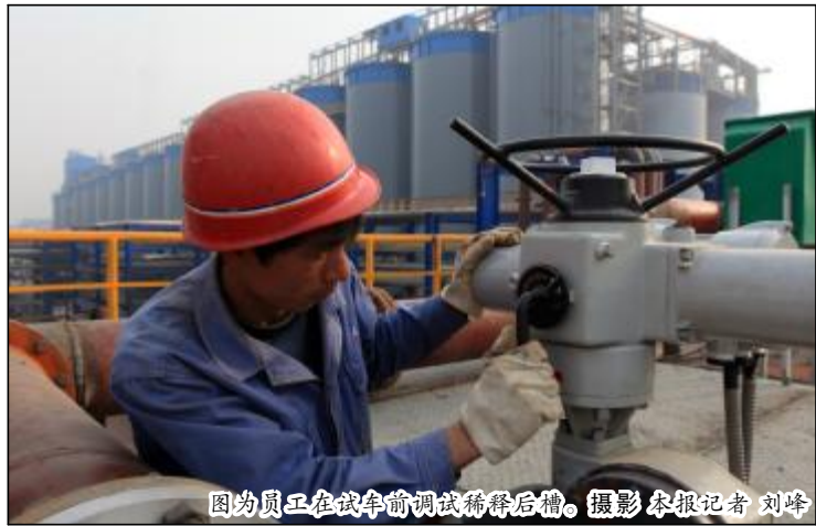
图为员工在试车前调试稀浆后槽。

自2011年6月3日氧化铝挖潜改造项目开工建设以来,项目建设指挥部优化设计方案,统筹安排进度计划,科学组织施工,加强安全管理,确保了工程建设进度和质量。在全体参建人员的共同努力下,2012年4月份,各子项陆续进入设备调试阶段。为确保试车工作的顺利进行,指挥部各专业组根据现场交叉调试工作量大的实际情况,制定了联合试车方案及现场处理问题应急预案,提前预测试车过程中可能出现的问题并采取应对措施,安排专人落实安全保障措施,确保各子项工艺管网形成完整系统,精心组织设备调试工作。各参建单位严格按照工程进度计划,细化、落实各项工作完成的时间节点,按照程序组织落实转动设备的确认和启动工作,确保主体设备规范运转,同时,加强施工力量,调整布局昼夜施工,全力以赴保4.20试车的顺利进行。(李麦莲)