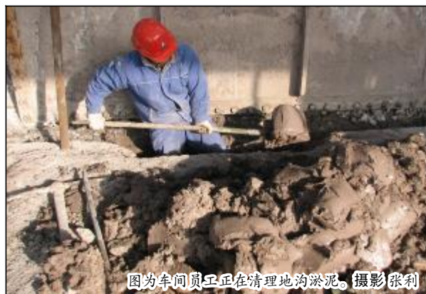
图为车间员工正在清理地沟淤泥。

一系列的举措与举措进一步激发了员工的工作热情，员工士气高涨，1至3月份，车间共整改各种隐患、泄漏点40余项，确保设备安全高效稳定运行。全员参与清理、清扫，隐患排查和泄漏治理，使车间设备见本色，环境卫生大为改观。也为生产稳定、无泄漏达标验收打下了坚实的基础。4月11日，分厂无泄漏验收检查组对车间现场管理给予较高评价，车间设备管理走上了良性循环的轨道。