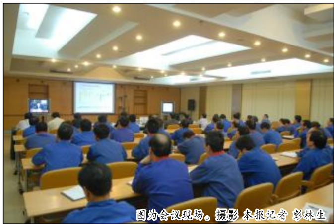
图为会议现场。摄影 本报记者 彭林生

刘祥民指出,一季度取得的成绩,主要得益于消耗方面的控制和采购方面的贡献,各企业要进一步抓好落实,发挥优势,努力推进各项工作。各企业要做好汛期准备工作,加强物资贮备,氧化铝企业要重点贮备铝土矿资源,为应对各种挑战做好物资准备。