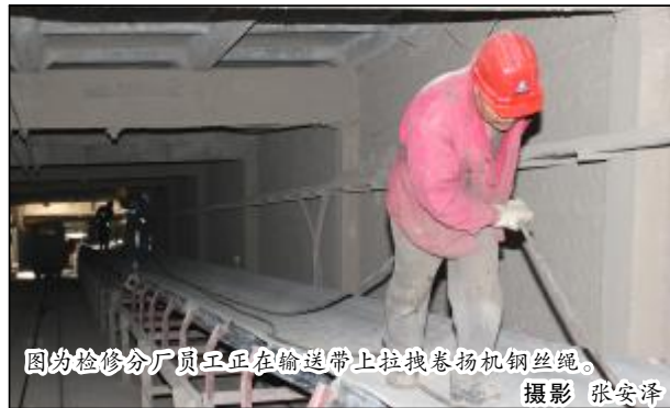
图为检修分厂员工正在输送带上拉拽卷扬机钢丝绳。

本报讯 经过30天的连续奋战,4月19日,检修分厂承担的石灰石矿斜井输送带更换工程提前完工,全面进入试车阶段。