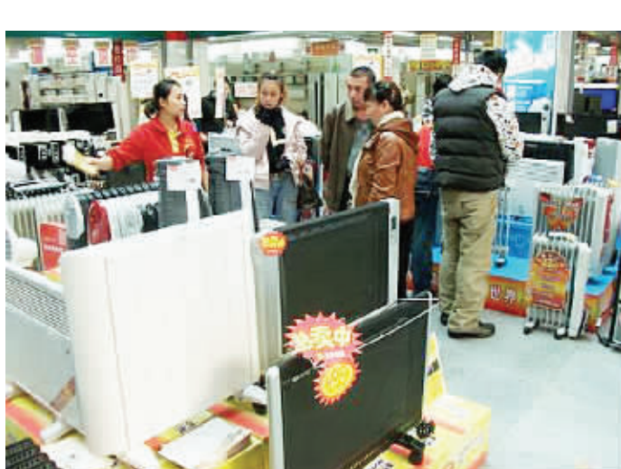
随着冬天的临近,取暖家电产品开始在市场热销起来。