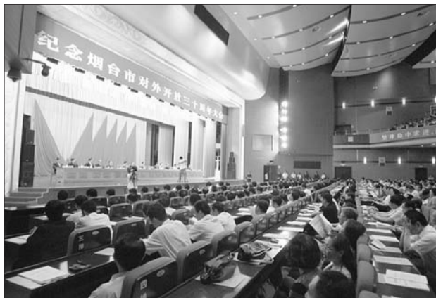
26日下午,纪念烟台对外开放三十周年大会在烟台国际博览中心召开。