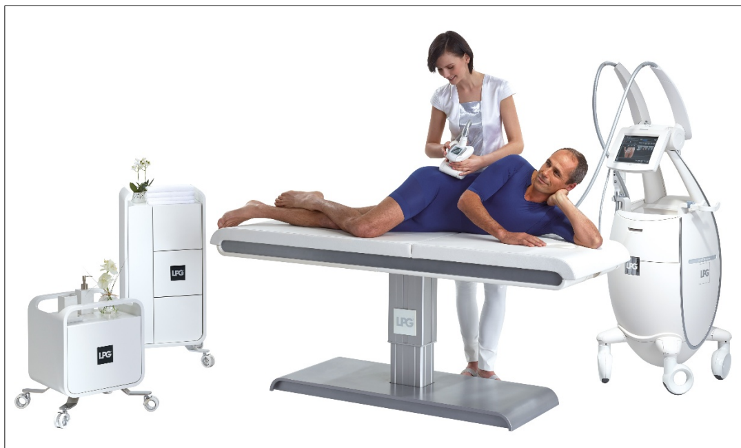
在使用揉滾按摩機進行療程時，病患必須穿著特製緊身衣，以加強療效。

時至今日，全球超過 110 個國家每天共約 200 000 人接受 LPG 技術的治療。大致上可分為兩種治療方式：最基本的方式是「LIPOMASSAGE」纖體雕塑，採用揉滾原理進行。治療師手持儀器為客人按摩。這個儀器有兩個單獨控制的滾輪，均由有刷直流馬達驅動。手持儀器的尺寸選擇視身體部位而定。在治療過程中，病患需穿上特製緊身衣，以加強按摩的功效。