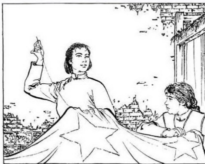
116. 江姐激动地说：“破坏一个旧中国，建设一个新中国，这是多么壮丽的事业。我们的革命，对人类，应该作出更多的贡献！”李青竹赞同地说：“这该有多美，多好啊！”