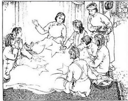
115. 珍藏的红旗拿出来了，这是“监狱之花”母亲的遗物。人们团团围上来，尽管不知道五星红旗的图案，但她们都把欢乐的激情寄托在针线上，织绣出闪亮的红星。