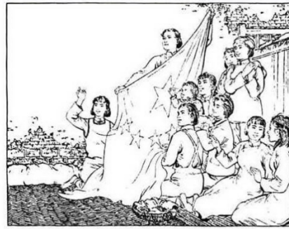
118. 人们请江姐展开这象征黎明和解放的战旗。江姐把红旗一抖，五颗金星在人们眼前闪耀，她无限激情地说：“让五星红旗插遍祖国，也插进我们这座牢房。”

(1)上面连环画的内容取材于中国当代文学名著《①》，作者是②和③。连环画讲述了④的情节，集中表现了红岩英雄的革命精神。(4分)