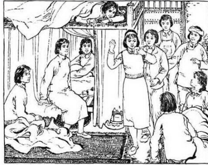
113. 战友们都挤过来，孙明霞念着：“一九四九年十月一日，毛泽东主席在北京向全世界宣布：中华人民共和国成立了！”人们都低声欢呼起来，打断了孙明霞的朗读。