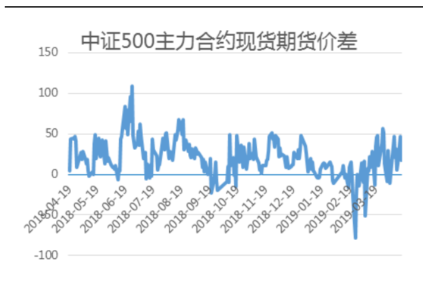
中证 500 主力合约基差