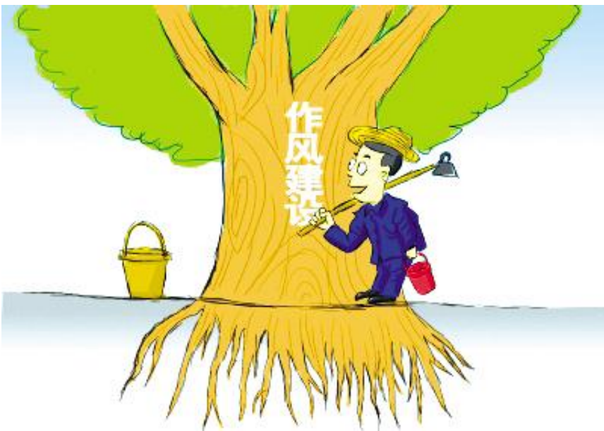
作风建设 水泥公司 李怡作

脚踏实地的做好每项工作，就是要贵在落实。知行合一，是对落实的具体要求和体现。“火车跑得快，全靠车头带。”现在我们并不缺少蓝图、制度、部署，但在一些工作落实上大打折扣、劳而无功，甚至事与愿违，一个重要原因就是少数干部不重视、不善于或者不愿意抓落实。《补充规定》明确“领导人员要恪尽职守、主动作为、敢于担当”，这更说明领导干部必须崇尚实干，扑下身子真抓实干，沉心静气抓落实，有计划、有步骤地扎实推进，一步一步地落实各项工作。习近平同志说：“干部干