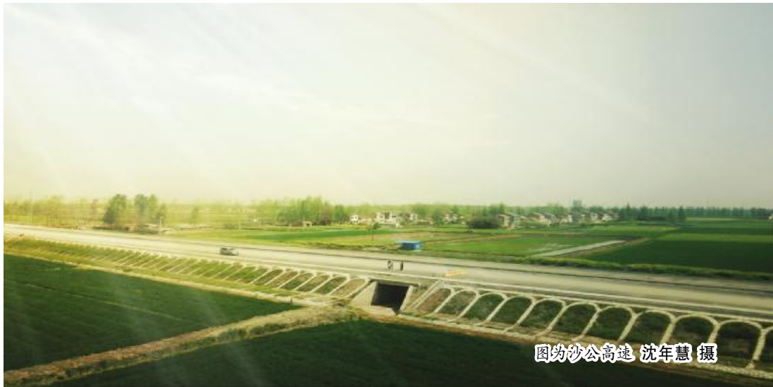
图为沙公高速

历史悠久的荆州古城,在现代化建设浪潮中,焕发着新的魅力。距离荆州市约三十公里,一公司参建的沙公高速项目步入尾声。在近三年的时间里,该项目多次得到业主的通报嘉奖,荣获“平安工地”示范标段、“优秀单位”、“文明单位”等荣誉。那沙公高速项目做到这些的秘诀在哪里?笔者深入沙公高速项目采访多人,却得到一致的答案——“绩效考核”。