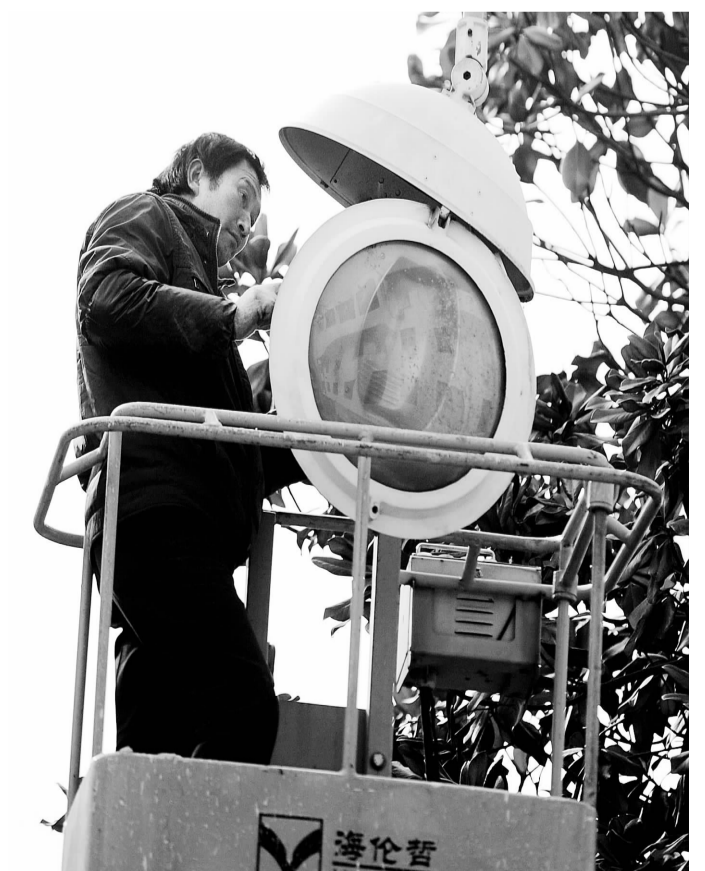
春节临近，为保证县城各街道路灯正常亮化，25日，我县相关单位组织施工人员对县城主要道路的路灯进行了一次全面的检修。图为施工人员正在健康路维修损坏的路灯。 陈义宝 梁德斌 摄/文

本报讯 2012年，县农机安全监理所以做好农机监理服务为宗旨，狠抓农业机械及驾驶操作人员的安全监督管理，农机安全监管工作呈现出“三高”、“一降”新局面。 “三高”：一是农机监理的信誉提高。通过开展各项农机便民服务为农机户排忧解难，为农村经济发展保驾护航，使农机手对农机监理工作更加支持和配合。二是农业机械的安全技术状态和农机手技术水平有了很大提高。通过阳光培训工程的实施，培养了一大批懂技术、能操作的农机手，驾驶操作水平不断提高。三是农机“三率”有了大幅提高。2012年，全县共办理拖拉机、联合收割机驾驶证189人，新挂发牌证844副，年检拖拉机、联合收割机2862台，挂牌率、持证率、年审率均有大幅度上升。 “一降”是农机安全事故下降。在日常的管理中，该所狠抓农机安全，建立健全各项规章制度，落实农机安全生产责任制，农机事故不断减少。（卢巧兰）