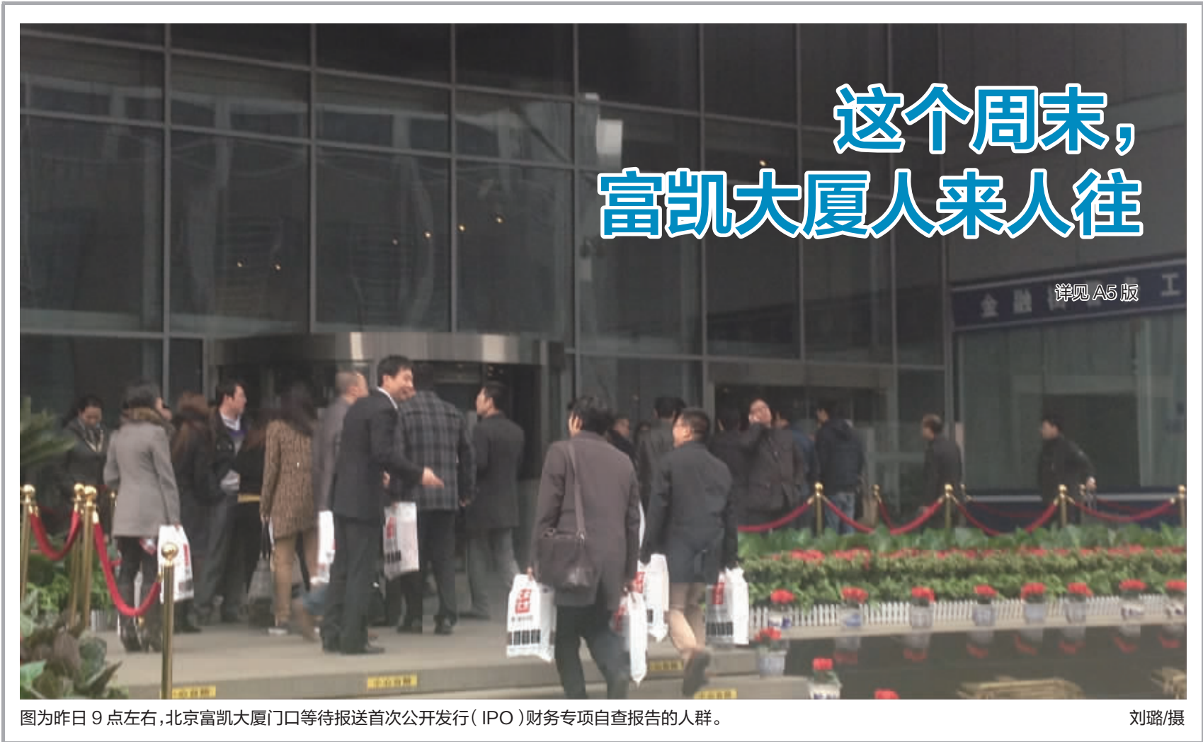
图为昨日9点左右,北京富凯大厦门口等待报送首次公开发行(IPO)财务专项自查报告的人群。

不过,信息公开是一个动态的、不断完善的过程。在信息传播渠道日益丰富、传播手段愈加多元的今天,只有加快完善信息披露制度,才能防止不法分子利用内幕消息或谣言进行非法牟利。监管部门也有理由带头做好“信息披露”工作,及时主动披露有关信息,防止市场谣言肆意传播,稳定市场情绪和预期。从上周五的表态看,肖钢主政的证监会将进一步推进监管信息公开,其中定期召开新闻发布会的“信披”承诺,将使市场疑问能够及时获得权威答复。这对资本市场无疑是个好消息!