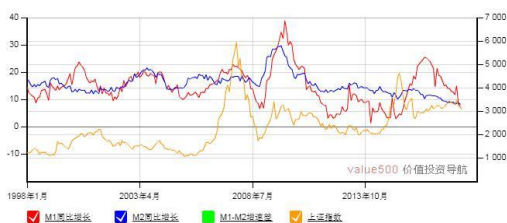
M1-M2 增速差与上证综合指数走势图

4. 天然气 | 昨日宁夏、内蒙古、山西等地 LNG 出厂价涨逾 800 元/吨，河南安彩、枣庄薛能、沧州中翔 LNG 出厂价淡季超 5000 元/吨，整体较昨日大幅上涨。近日国内 ING 以涨价为主，西南和华东最为显著，液厂效益良好。受青岛峰会影响，部分液厂减少供货。液厂开工较低，部分液厂 ING 工厂因气源问题无法开机。受限气影响，近期价格持续上升，东北地区 ING 价格仍保持稳定，交投较好。