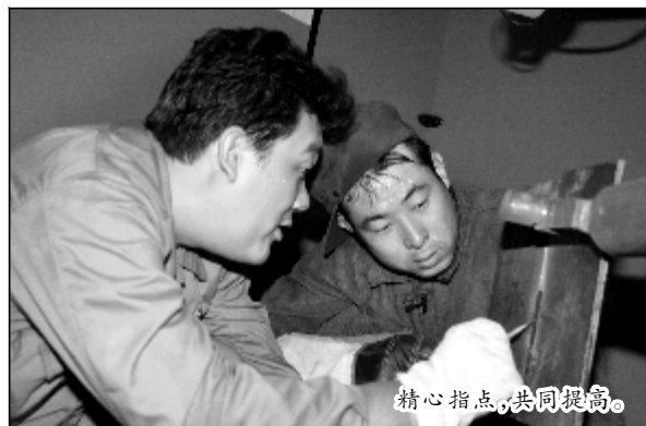
精心指点,共同提高。

“三岗”活动中,检修分厂掀起了学技术、竞水平的热潮,这股热潮胜过了盛夏的酷热。已过22时,当笔者离开基地时,灯火依旧通明,员工们还在加紧练习,浑然忘记了时间。