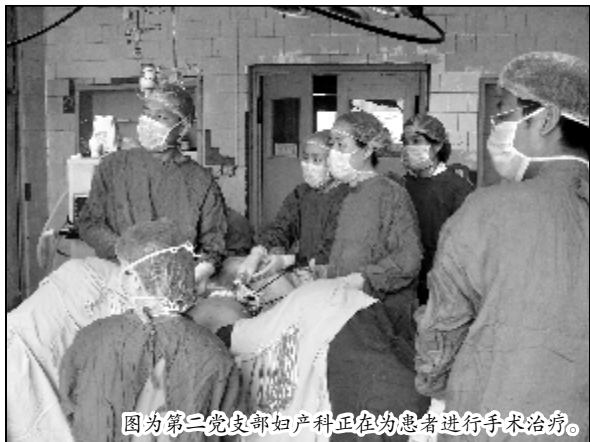
图为第二党支部妇产科正在为患者进行手术治疗。

职工医院实行“开门办院”的方针，采取“请进来，走出去”的方式，开展了多项新技术、新项目的开发应用。该支部积极响应医院号召，所属科室先后开展了腹腔镜胆囊切除术、子宫切除术、宫腔镜检查及治疗、膀胱镜检查、经尿道前列腺切除及经尿道膀胱癌切除术、经尿道膀胱结石取出术、关节腔镜检查及治疗、鼻窦镜检查及治疗等，另外开展了颅内血肿微创引流术，开创了微创治疗的先河。骨科开展了臭氧治疗椎间盘突出症，取得了良好的治疗效果。新技术、新项目的开发应用，使支部所属科室的医疗水平得到了极大的提升，来科室看病接受治疗及住院病人数量明显增加，床位使用率有效提高，手术台次明显增多。