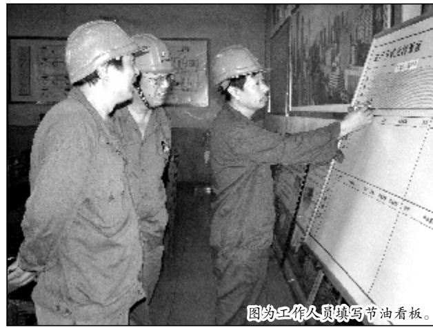
图为工作人员填写节油看板。