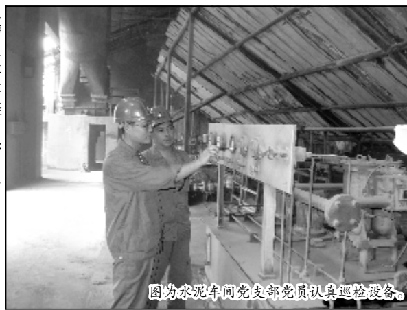
图为水泥车间党支部党员认真巡检设备。

如今，车间党政一班人紧密配合，正积极努力推行先进的管理模式和经验，从加强班子成员管理、调动员工积极性入手，大力开展劳动竞赛活动，加大激励力度，出现问题跟踪全力查找原因，为生产扫清一切障碍，同时在强化质量和产量上实行内控管理，提出各项改进措施，确保车间生产经营任务能顺利完成，为企业挖潜增效作出新的贡献。