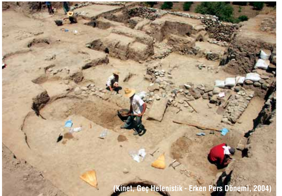
(Kinet, Geç Helenistik - Erken Pers Dönemi, 2004)