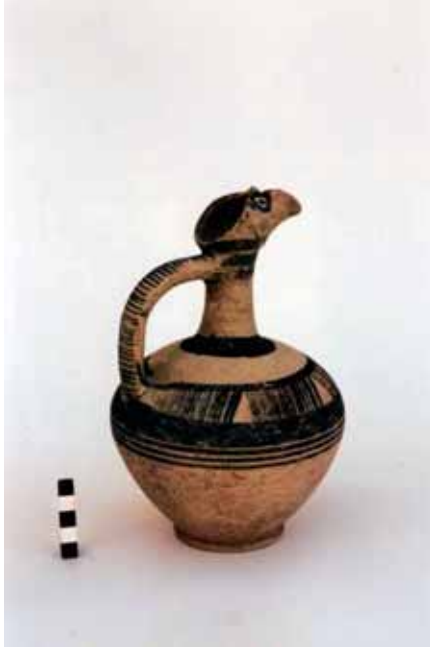
(Orta Tun Çaęı "Cilician Painted Ware")