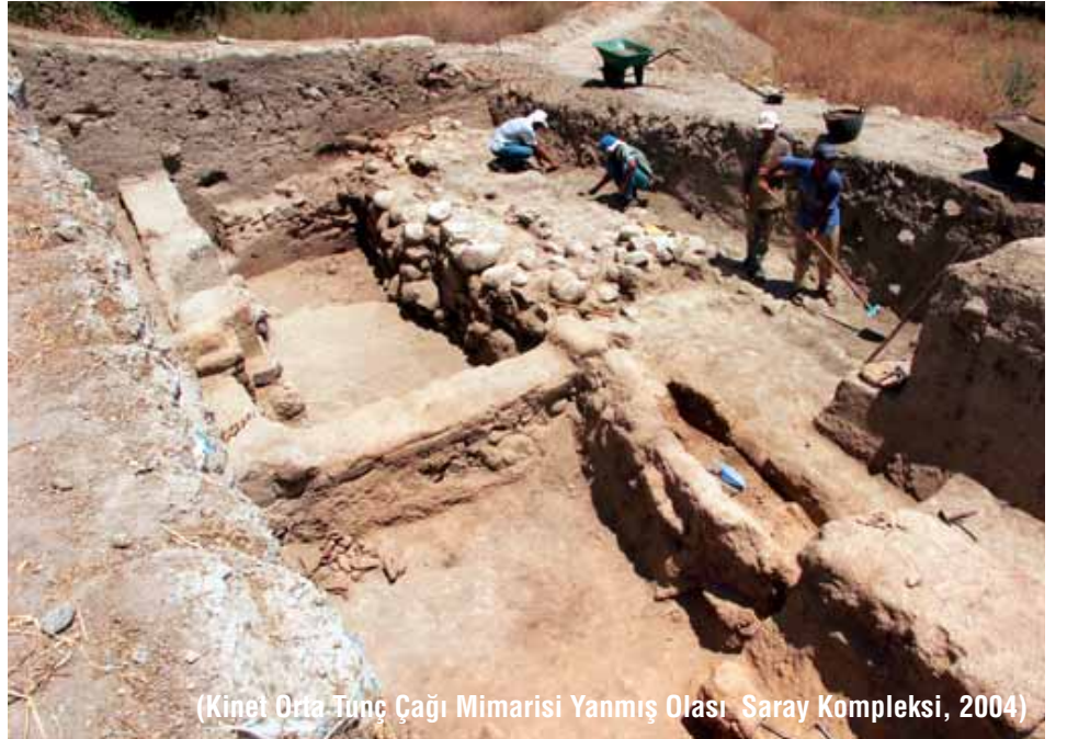
(Kinet Orta Tunç Çağı Mimarisi Yanmış Olası Saray Kompleksi, 2004)