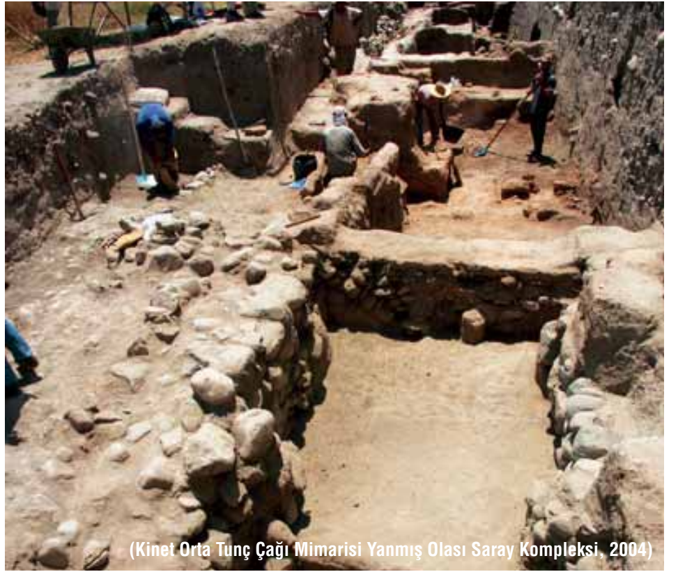
(Kinet Orta Tunç Çağı Mimarisi Yanmış Olası Saray Kompleksi, 2004)

Daha önce hiç tecrübem olmadığı için bir açma sorumlusunun yanında asistan olarak çalışıyordum. Her ne kadar arkeoloji bölümünde okumuş da olsam,