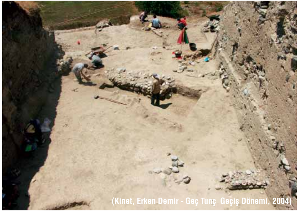
(Kinet, Erken Demir - Geç Tunç Geçiş Dönemi, 2004)