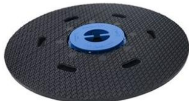
MALISH (美国) 针盘