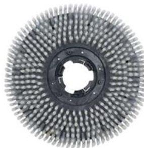
MALISH (美国) 洗地刷