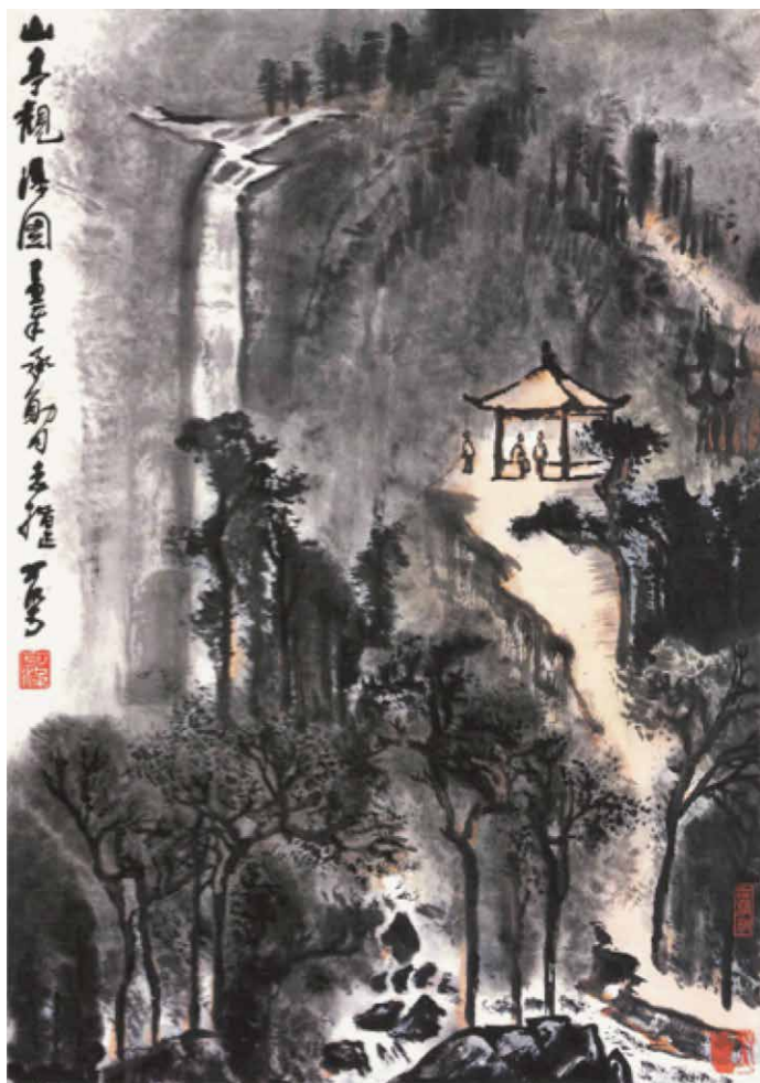
罗孚旧藏 李可染 山亭观瀑图