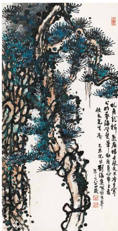
刘海粟画赠李侠文《双松图》 设色纸本 132*66.5cm 成交价：155.25万元 广东崇正2014春拍第38号拍品