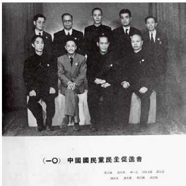
1949年李子诵以民促成员身份出席全国政协首次会议