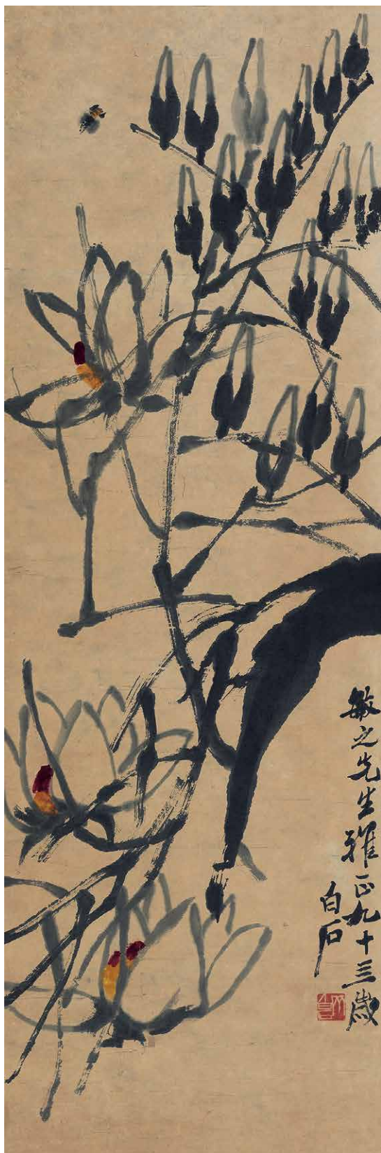
曾敏之藏齐白石《玉兰蜜蜂》 104.5×34.5cm 成交价：235.75万元 广东崇正2014春拍第68号拍品

胜利后弃官复投星系报业，出掌《星岛日报》，兼任晚报社长。期间刻意培养提携永定籍报界新秀，也广交左翼文人如陶行知、邹韬奋、郁达夫、金仲华、曹聚仁等。在解放战争期间，中共华南分局饶彰风派遣张问强、潘朗、司徒丙鹤等十余共产党人，在林霭民的默许和支持下，潜入星岛，当中有当主笔，有当编辑和记者，可以掌控《星岛日报》各版面，用以宣传报道解放战争。当中司徒丙鹤是由广州《前锋日报》调入星岛任编辑，主编华南新闻版。时国民党封锁消息，在南京、上海、武汉、广州等大城市民众，都希望从《星岛日报》了解内战消息。解放后有广州中共地下党人回忆：当时上级通知“了解时局，可参看『星岛』，那里有我们的朋友在编报。”