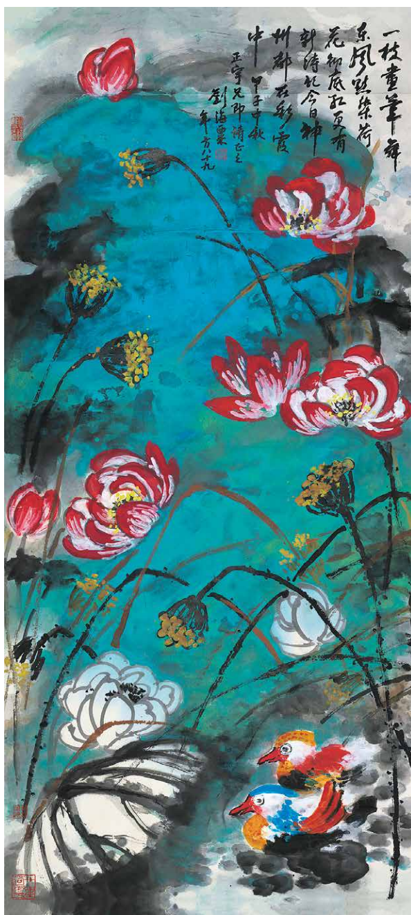
王家楨藏刘海粟《红荷鸳鸯》 设色纸本 180×83cm 成交价：241.5万元 广东崇正2014年春拍12号拍品

王家楨在澳门日报时喜逛烂鬼楼，与大石也投缘。文革时期，上面下令，所藏书画要交出。罗孚大胆不理，王家