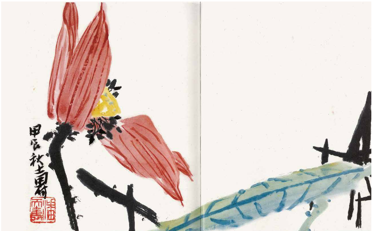
潘天寿画荷赠马国权