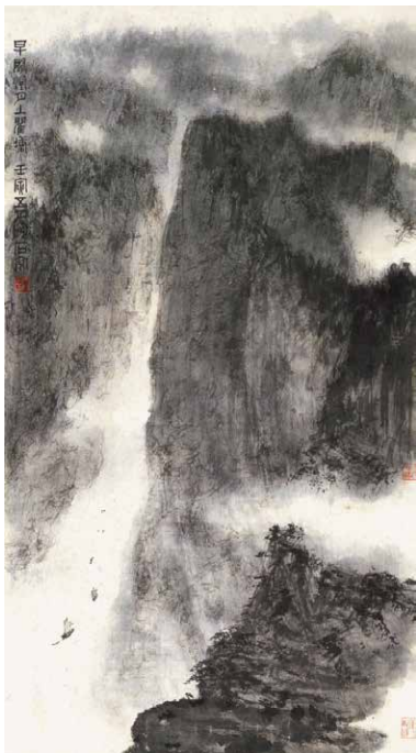
费彝民藏傅抱石《早随烟月上瞿塘》

是罗孚催生的；李怡的才华，也是罗最早发现，并鼓励支持的；董桥、小思的著述，是罗最早向中国大陆推介的。