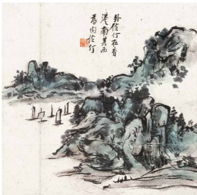
罗孚旧藏 黄宾虹 外伶仃