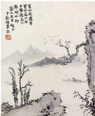
林福民藏刘海粟《春树孤村》 设色纸本 31×26cm 成交价：21.85万元 广东崇正2014春拍第105号拍品