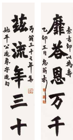
罗孚旧藏 弘一 楷书五言联