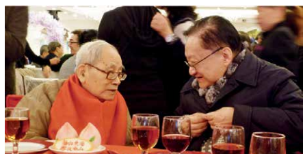
罗孚九二华诞与金庸笑谈