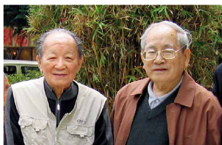
黄苗子与罗孚2004年12月23日在香港合影