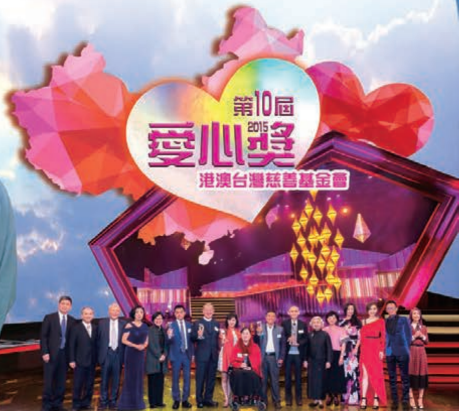
2015年12月9日於TVB舉辦隆重頒獎典禮 愛心獎得獎人、主禮嘉賓合照。