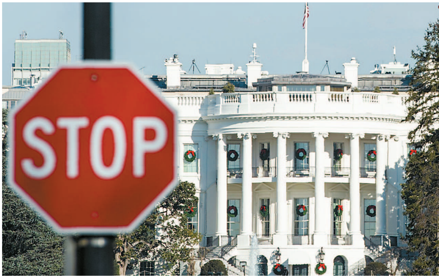
美参议院去年12月27日下午短暂复会,未能就预算僵局取得任何进展,政府部分机构“停摆”将持续。图为美国白宫。

华盛顿美国国家档案馆,游客入口处一张“关门”告示让人望而却步。卡特·伍德森国家历史遗址、福特剧院、彼得森剧院等也都关闭。总统公园可以进入,但洗手间等