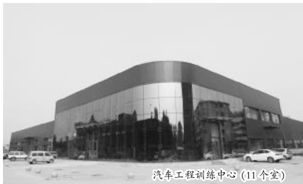
汽车工程训练中心(11个室)

一、实训设施先进齐全,设有机电工程训练中心、机械加工技术培训中心、汽车工程训练中心等三大实训实习基地。包括材料力学实验室、液压传动实验室、公差测量实训室、金相实验室、机原机零实验室、数控车实训区、数控铣实训区、特种加工实训区、模具应用实训区、模具制造实训室、逆向工程实验室、CAD/CAM 实训室、电工电子实验室、电工实训室、电子实训室、单片机实训室、检测技术实验室、PLC 实训室、机床电气实训室、自动生产线实训室、工业机器人实训系统、创新工坊、数字化工厂(PLM 体验区、一体化讨论区、可视化管理、资源管理等)、机加工车间、钳工车间、焊工车间、管工车间、汽车认知与维护保养、汽车底盘构造、汽车发动机构造、汽车电子电器、汽车发动机管理系统、汽车底盘管理系统、汽车车身管理系统、汽车故障维修、汽车整车拆装检测、宝马奔驰实训室、模拟 4S 店等 40 个实训室(车间)。其中汽车工程训练中心是中央财政支持的实训基地。