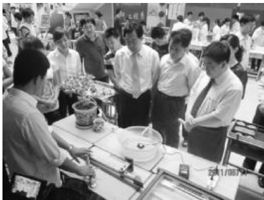
创新社团作品(自动浇花器)