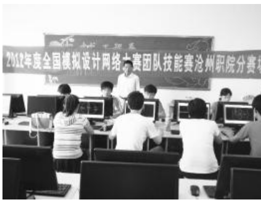
Cad 社团参加全国模拟设计网络大赛团队技能赛