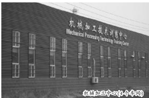
机械加工中心(4个车间)