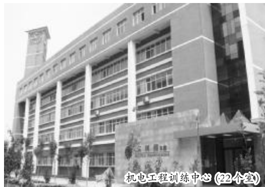
机电工程训练中心(22个室)

二、师资力量雄厚:现有专任教师 30 人,其中教授 3 人,副教授 8 人,讲师 15 人,硕士研究生 15 人。省部级教学名师一名。双师素质高,其中高级工程师 4 人,工程师 5 人,高级工 10 人。还拥有一支由企业专家组成的兼职教师队伍。