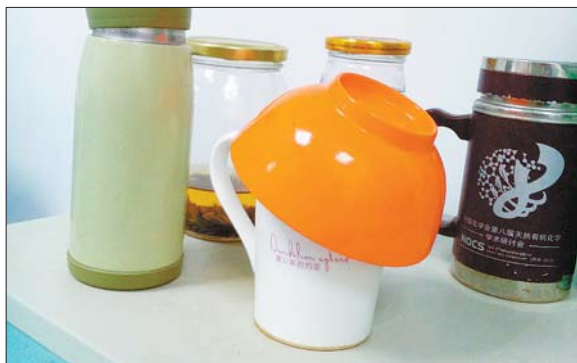
@叮咚小卷:又是一年苍蝇乱飞时。一同事杯子本身不带盖儿,某日被飞来飞去的苍蝇逼急了,就抄来一饭碗给扣上了。不得不说不说女汉子就是霸气!