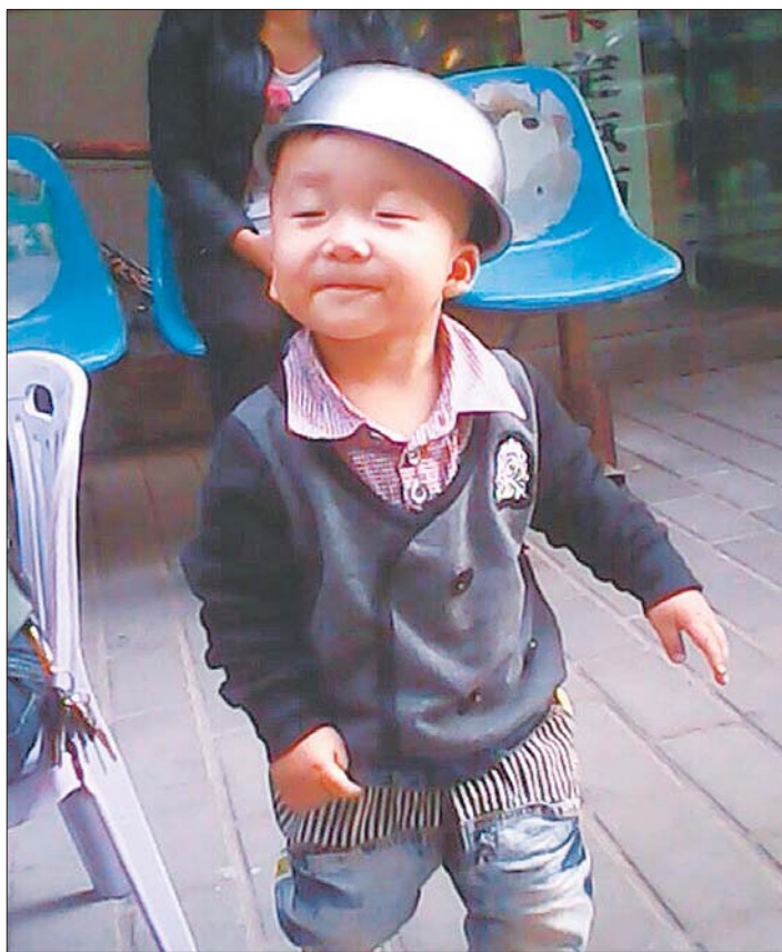
@老夫醉过知酒浓:小男孩戴着一个不锈钢盆自娱自乐,玩得特别开心。