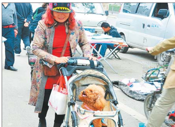
@崑崙山泉:在大街抓拍到的一场景,好有爱。