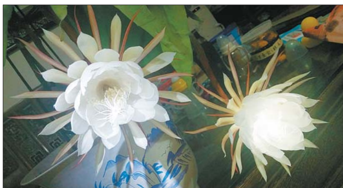
@香香季风:昙花接着开,昨夜一朵今晚两朵。