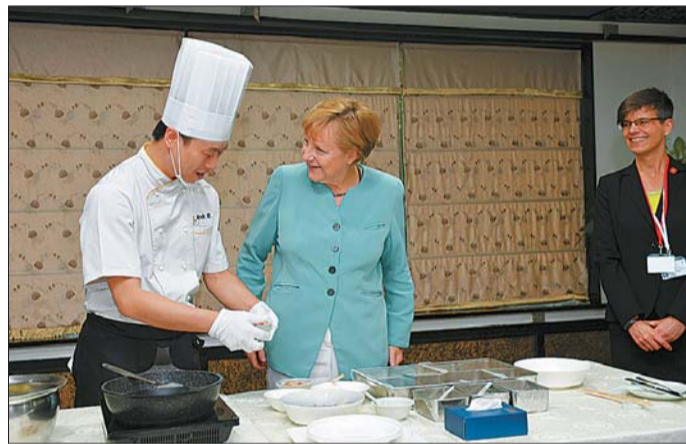
默克尔学做宫保鸡丁。

从事厨师行业14年的大师傅张为给默克尔炒了一盘宫保鸡丁。考虑到安全，这份菜是在大厅用电磁炉炒的。默克尔一来就用手拿了作为原料的花生米品尝。这份宫保鸡丁的分量比平时小1/3，辣椒和花椒也放得少一些。默克尔熟练地使用筷子，几乎吃完了一整盘，还招呼旁边的人一起品尝，口里一直说very good。