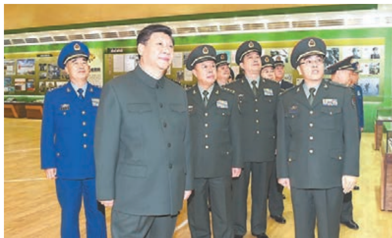
■習近平25日視察解放軍報社。

香港文匯報訊 中共中央總書記、國家主席、中央軍委主席習近平25日視察解放軍報社時強調，要緊跟強國強軍進程，弘揚改革創新精神，堅持軍報姓黨、堅持強軍為本、堅持創新為要，努力使解放軍報政治上更強、傳播上更強、影響力上更強，為實現中國夢強軍夢提供有力思想輿論支持。