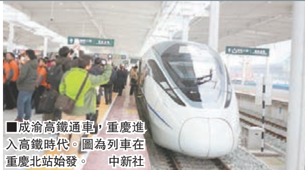
■成渝高鐵通車，重慶進入高鐵時代。圖為列車在重慶北站始發。

香港文匯報訊 隨著G8508次動車於昨日上午9時07分駛離始發站重慶北站，標誌着成渝高鐵建成通車。中國西部唯一的直轄市重慶自此結束了沒有高速鐵路的歷史。重慶至成都高鐵車程約為1個半小時。據重慶市交委人士透露，待目前正在改造的沙坪壩站、重慶站完工後，成渝高鐵全線運行時間最短可縮至1小時，且有望實現班次公交化開行。屆時，重慶和成都兩座城市將進入「一小時經濟圈」範疇。