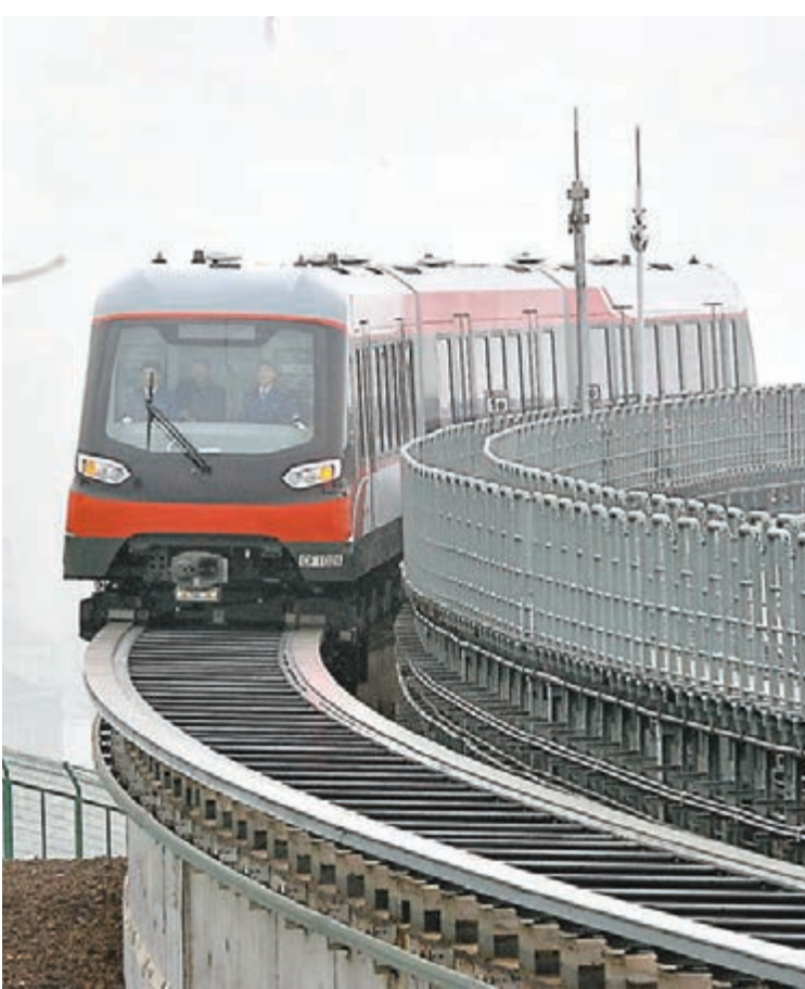
■湖南長沙中低速磁浮快線昨日試運行。

中國工程院院士劉友梅表示，長沙中低速磁浮工程列車的成功研製，使得我國軌道交通產業主機企業及其產業鏈，攻克了中低速磁浮列車系統集成技術，研製了擁有自主知識產權的懸浮系統、適應1,860毫米軌距的懸浮架以及高可靠性的整車電氣系統。這也填補了中國中低速磁浮自主知識產權的工程化和產業化運用領域的空白，在世界中低速磁浮列車技術領域居於一流水平，使中國成為繼德國、日本、韓國後，世界上第4個掌握該項技術的國家，具有十分重要的社會效益、顯著的推廣和示範效應。