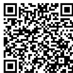
苹果客户端二维码