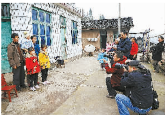
1月27日,沅陵县摄影协会会员在二酉苗族乡为乡村“留守人员”拍摄照片,以寄给在外打工的亲人。春节将至,沅陵县委宣传部、县文联开展送文艺下乡活动,使农民群众感受到党和政府的关怀与温暖。

雨花区高度重视见义勇为工作,着力健全见义勇为权益保障机制,筹划成立了见义勇为奖励和保护基金。近年来,区、街(乡、镇)两级共投入见义勇为资金300余万元。为确保不出现“英雄流血又流泪”现象,雨花区建立了对见义勇为先进个人进行及时慰问回访、提供法律援助、实行司法救助和社会救助四大维权救助机制。拨付各类慰问救助资金80万元,营造了全社会关心见义勇为英雄、爱护见义勇为英雄的良好氛围。区委书记周杏武说,弘扬见义勇为精神,是人民真情的渴望,党和政府的职责所在,一个同唱英雄赞歌的城区,必定生机勃勃。今天,该区为这些见义勇为个人发放慰问金17万元。