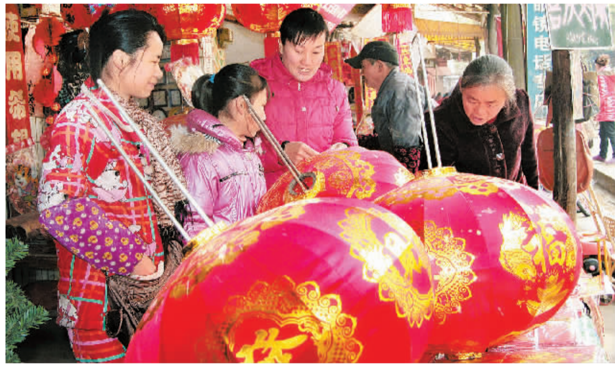
1月26日,邵阳县下花桥镇几位顾客在集市选购过年饰品。春节将至,邵阳县城乡集市处处洋溢着节日气氛。

去年底,该镇发出公告,面向全镇45岁以下、高中以上学历的有志人士公开选拔30名村级后备干部。经过初选,有116人符合应试资格,其中具有大专以上学历的占48%,35岁以下的占83%。镇党委严格按照公开选拔的相关原则,组织笔试、面试和考察,最后按照综合成绩和考察结果确定30名村级后备干部。