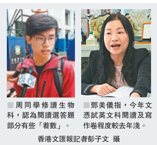
▲周同學修讀生物科，認為閱讀選答題部分有些「着數」。

香港文匯報訊（記者 柴婧）中學文憑試昨舉行英文科卷一閱讀和卷二寫作考試。有英文老師表示，近年英文科難度好像按年「高低交替」，繼去年難度較高後，今年試卷傾向簡單，例如今年閱讀卷長問答題目為歷屆文憑試最少，且深單詞不多，預計整體合格率會較去年提升；作文難度亦不高，但有題目內容新穎亦有「陷阱」，考生需仔細審題才能穩奪高分。