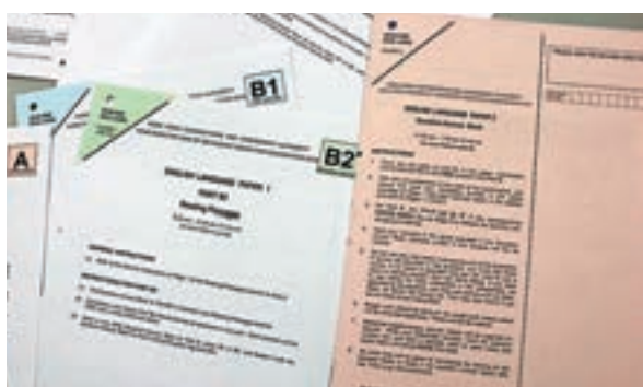
▲中學文憑試（DSE）昨日開考英文科，考生在一天內應考英文卷一及卷二。