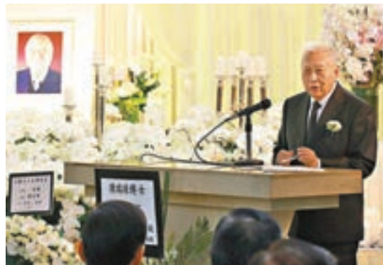
▲董建華在儀式上致辭悼念陳瑞球。