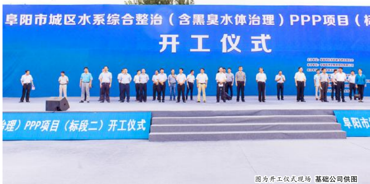
图为开工仪式现场

据悉,阜阳市城区水系综合整治(含黑臭水体治理)PPP项目将阜阳市205平方公里范围内的45条内河打包进行治理,该项目已列入国家财政部第三批示范项目,是目前安徽省最大的水系治理PPP示范项目。其中,由葛洲坝集团作为联合体牵头方,基础公司总承包施工的标段二,包括了28条河道工程、1座排涝泵站、151.45公里截污管道、11座调蓄池、16座蓄水池、桥梁拆除50座、桥梁重建32座、桥梁新建19座。