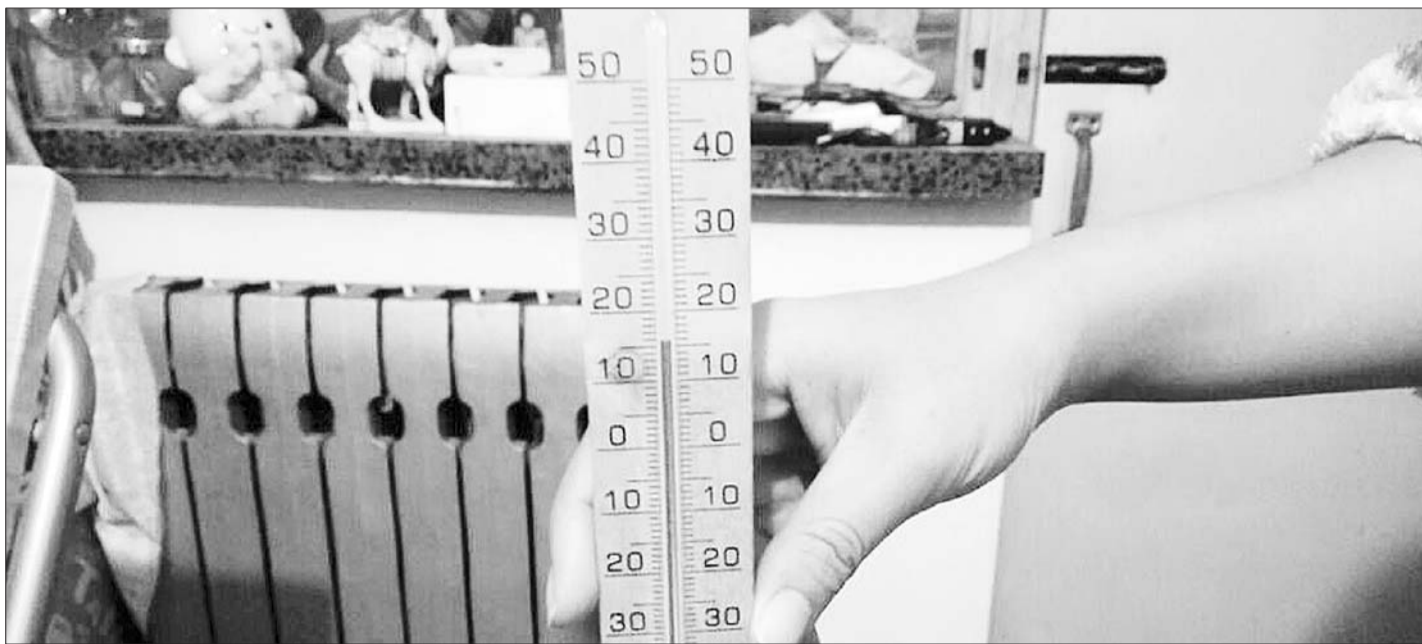
温度计紧靠着暖气片,温度才刚过15℃。

据悉,济南集中供热的燃煤锅炉分为三步走:一是需要进行优先替代的32台老旧锅炉,计划在1-2年内淘汰;二是需要暂时保留的42台锅炉,待3-5年热源保障到位后逐渐替代;三是北部、浆水泉等大型热电(源)厂,继续加大煤炭清洁利用技术改造。