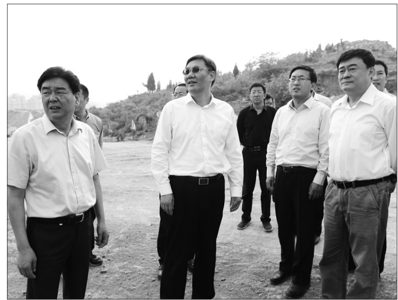
去年以来,济南市强力推进大气污染防治,市委、市政府、市人大、市政协主要领导每月两次分8路带队进行环保突击暗访检查。图为省常委、济南市委书记王文涛(左二)和副市长王新文(右二)在市委主任蒋向波(左一)、市环保局局长高立文(右一)陪同下,暗访督察工地扬尘污染控制情况。