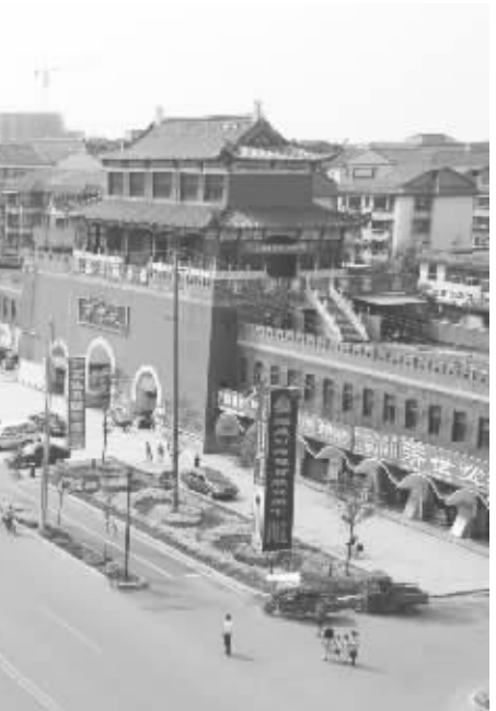
宽敞整洁的蒸阳大道

文明创建的主体是群众。曾几何时，一首“逛个县城几分钟，瓜子纸屑随便扔，街头巷尾摆牌桌，三五成群‘砌长城’”的打油诗流传西渡的街头巷尾，也道出了当年衡阳县城西渡镇的旧貌。在多年的探索实践中，历届县委、县政府清醒地认识到，一个地方的文明程度有多高，关键是看人的文明素质有多高，创建文明县城，首先是要着力提高人的素质。1996年，衡阳县委、县政府号召广大市民学习张家港先进经验，讲卫生、树新风，拉开了蒸阳大地文明创建的序幕。如今，创建文明县城已成为县委、县