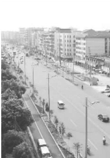
宽敞整洁的蒸阳大道

中心路、新正街西路、滨江防洪堤的路灯改造；对向阳南路和新正街等主要街道全部铺设了改性沥青，下水道进行了全面的清理并更换了沟盖板，每隔30米安装了高标准的高杆灯，除电力高压线外，其余的管线都下了地。对壕塘路、中心路等人行道进行了改造；对杨冲路等11条背街小巷进行了路面硬化；利达垃圾处理场、县城污水处理厂、水上环卫清运垃圾专用码头建设迅速启动；建材经营退临街铺面入专业市场为改善县城环境助力让行；县城城雕、洪山大桥、明翰、船山两个广场、19座公交候车亭等为县城扮靓新景；采用点（广场、公园）、