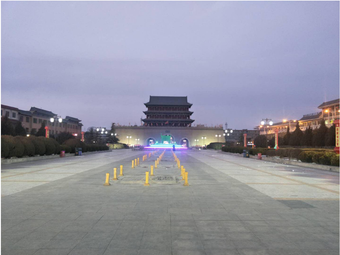
南城門廣場中央燈組：十二生肖