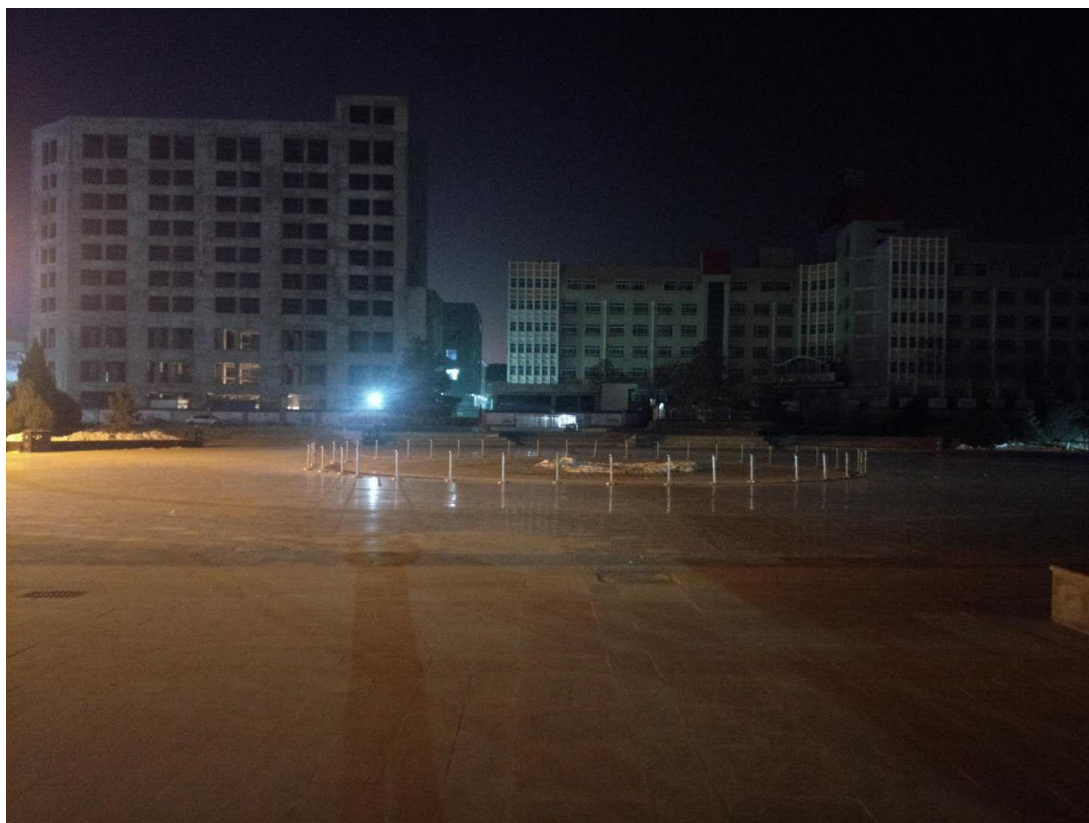
文化广场南侧喷泉处灯组：改革开放 40 周年