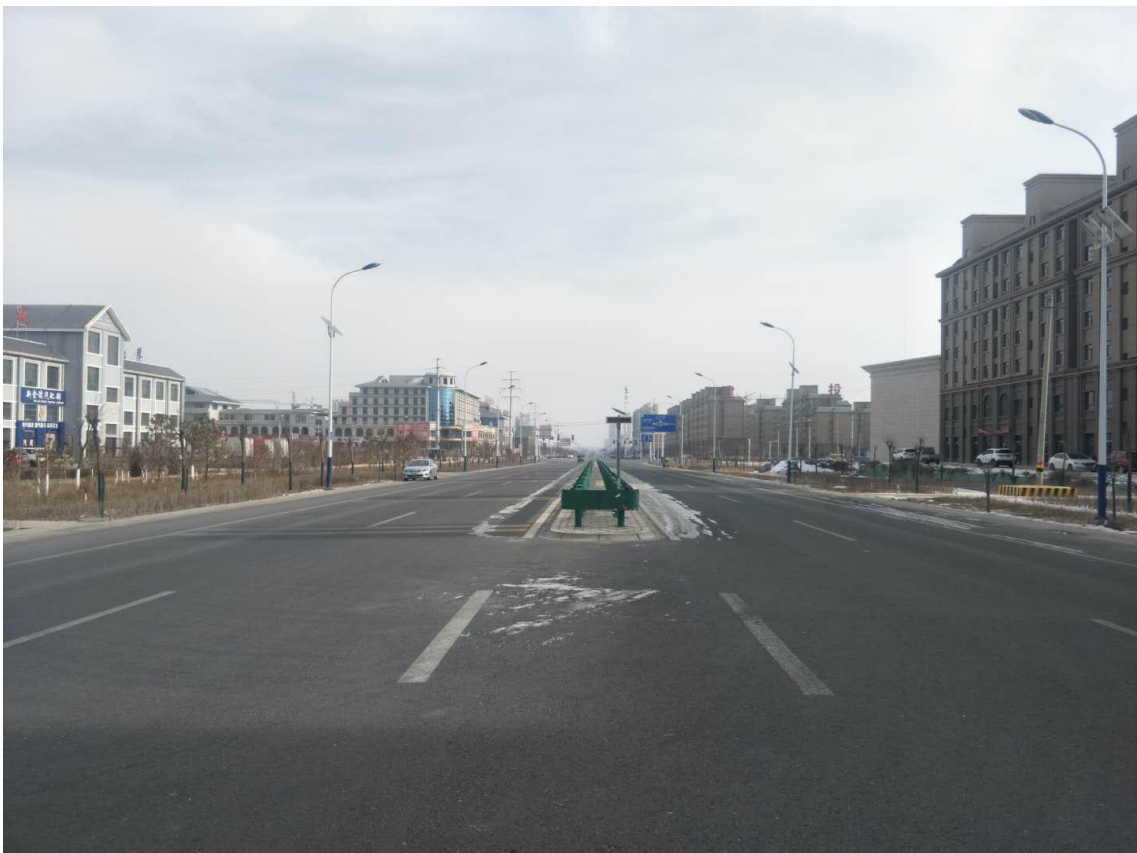
北入市口兩側綠化帶燈組：葡萄酒桶造型