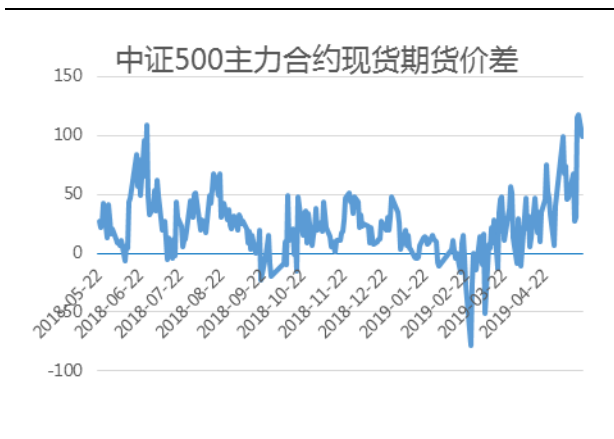
中证 500 主力合约基差