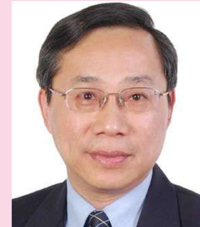
民盟中央副主委,上海市人大常委会副主任,民盟上海市委主委