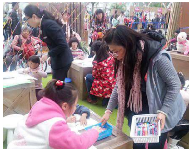
信息技术学院学生家长也做志愿者