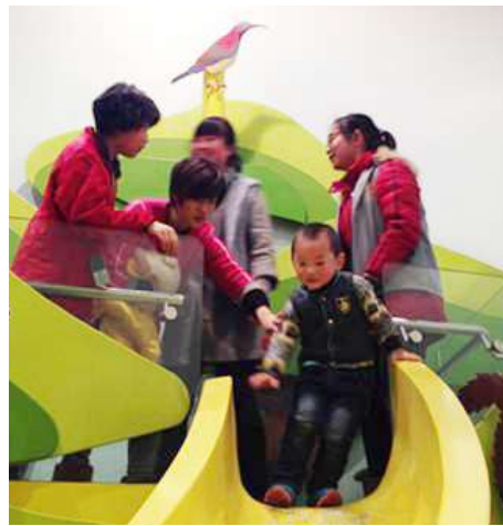
引导小朋友安全玩耍