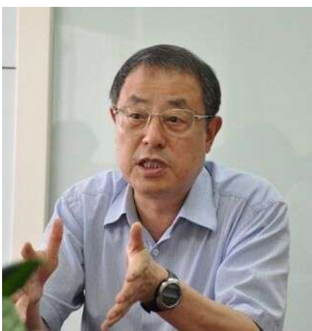
原上海市科教党委副书记