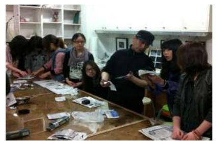
建桥版画社师生生活活动 (本报记者)

近日,经专家评审,上海市民办教育发展基金会研究确定,我校版画社成为首批“七彩计划”资助项目。