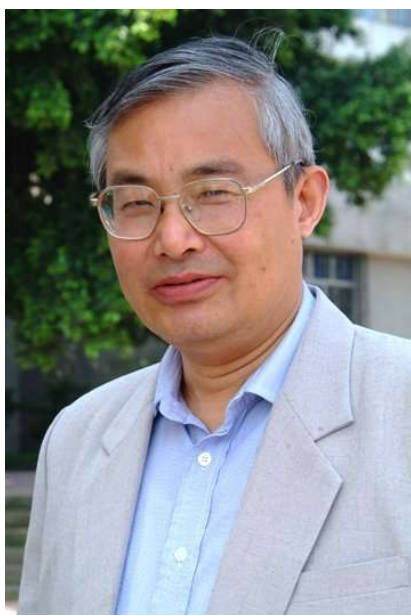
上海大学原常务副校长