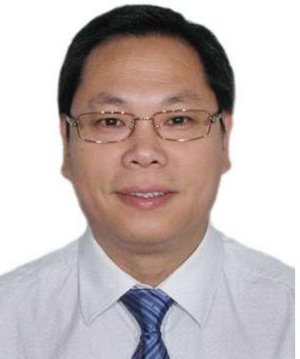
正泰集团董事长、副总裁