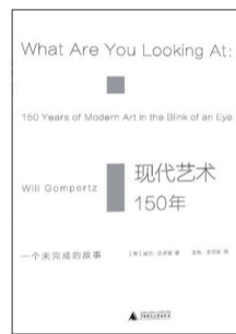
《现代艺术150年：一个未完成的故事》 作者：[英]威尔·贡培兹 出版社：广西师范大学出版社

格拉迪米尔通过将漫画体裁发挥到极致，以幽默诙谐的方式向最伟大的画家们致以最崇高的敬意。本书令人印象深刻的地方不仅在于华美壮丽的画面分镜、惟妙惟肖的名画重现，还在于让人忍俊不禁的对白和情节。