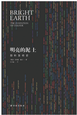
《明亮的泥土》 作者：[英]菲利普·鲍尔 出版社：译林出版社

1504年，佛罗伦萨市政大厅，达·芬奇与米开朗基罗，《安吉里之战》与《卡西纳之战》。艺术史上的一场巅峰对决。达·芬奇之惜败，不在于画艺，而是工艺上的受挫。他在灰泥墙上绘上热熔蜡所调制的色彩，这种颜料干得特别慢，为了赶时间，他采取了加热熏干的处理，《安吉里之战》的画面因此成了乱糟糟难以辨认的色块。