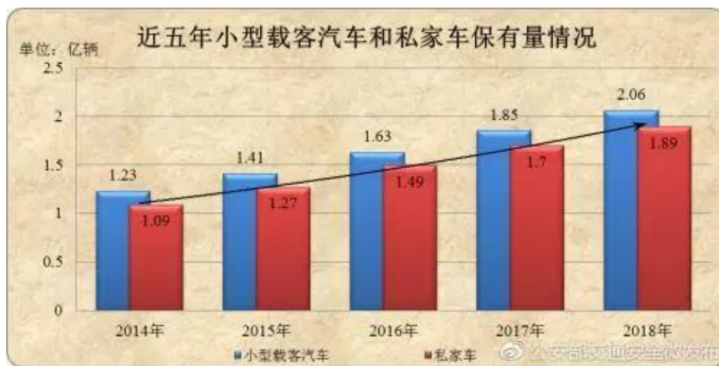
近五年小型载客汽车和私家车保有量情况近五年小型载客汽车和私家车保有量情况

据公安部交管局统计，截至 2018 年底，全国新注册登记机动车 3172 万辆，全国机动车保有量已达 3.27 亿辆。2018 年，全国机动车驾驶人数量达 4.09 亿人，其中汽车驾驶人达 3.69 亿人，近五年全国机动车驾驶人数量呈现持续大幅增长趋势，年均增量达 3012 万人。