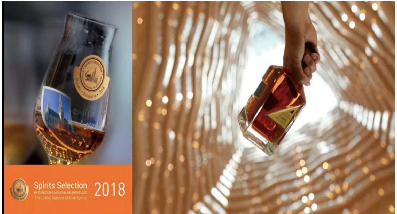
珍藏版五星白兰地获 2018 年布鲁塞尔国际烈酒大赛金奖