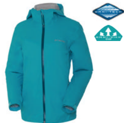
女式Omni-Tech奥米·防水夹克

Omni-Wick Evap奥米·高效速干技术能够将汗水分散到衣服表面,扩大水分蒸发面积,加速蒸发速度。独有的腋下透气设计可更好保持干爽。