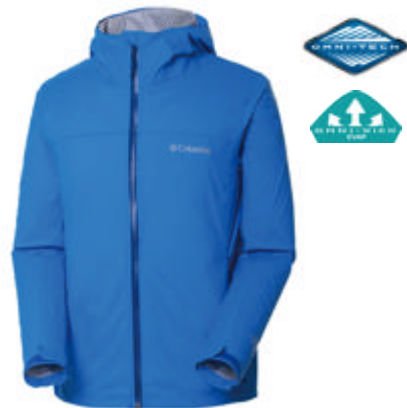
男式Omni-Tech奥米·防水夹克

春季出行户外露营,推荐使用Columbia春夏新款防水可收纳冲锋衣RE2023。Omni-Tech奥米·防水技术提供了良好的防水性能,可迅速排出皮肤湿气。