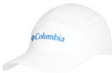
Columbia哥伦比亚 男式防晒降温速干帽

装备建议：夏季早晚冲锋，白天快干，夜晚需抓绒衣或羽绒，背包最好不要超过20kg。