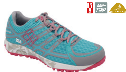
女式Outdry立体轻盈防水鞋

Techlite轻盈缓震技术结合多元稳定缓震中底，给予舒适体验及缓震保护，无痕Omni-Grip奥米·户外抓地技术配合微型鞋钉设计，抓地耐磨。