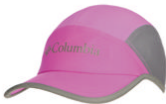
Columbia哥伦比亚 女式防晒降温速干帽