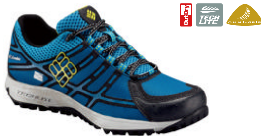
男式Outdry立体轻盈防水鞋

路况复杂，环境多变，推荐穿着Columbia防水多功能徒步鞋，Outdry立体轻盈防水鞋帮配合保护性鞋头，持久保持干爽和轻便。