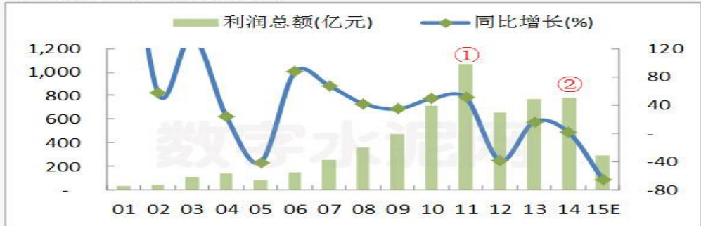
本世纪以来年水泥行业利润