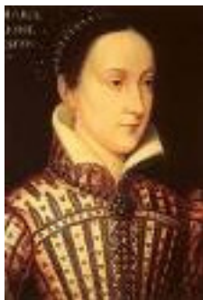
图 22. 玛丽女王

(1) 玛丽女王: 1578 年,因国内危机而逃亡英格兰的苏格兰玛丽女王被伊丽莎白女王软禁。1586 年 1 月 6 日,玛丽收到一批秘密信件,里面是她过去的侍从、当时在欧洲大陆的 24 岁的安东尼·贝宾顿 (Anthony Babington) 和她另外一些忠实追随者准备营救她的计划。