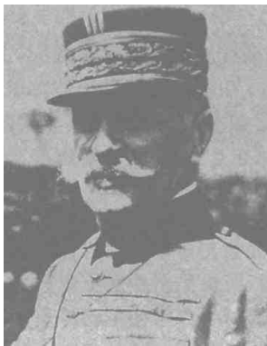
图 30. 联军统帅福煦元帅

而且，关键是德国人要的只是协约国这边在战役结束之前不能破译即可，而协约国特别是法国这边，却必须在德国发起攻势之前——还不能是已经临近敌人进攻开始的“之前”，还必须得让自己有起码的反应、调动、准备的时间——