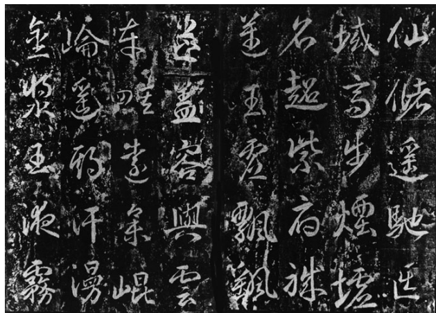
图 26. 武则天《升仙太子碑》拓片