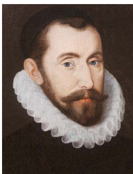
图 23. 沃尔辛汉姆勋爵

这些信件都是用密码写成、由贝宾顿交给一个对玛丽女王表现非常忠诚的天主教神甫吉法德带进监狱交给玛丽的。然而,贝宾顿怎么也没想到,这个吉法德却是伊丽莎白女王的间谍,执行英格兰大臣沃尔辛汉姆 (Walsingham) 爵士的命令。其结果,自然是所有这些信件都首先出现在沃尔辛汉姆的办公桌上。