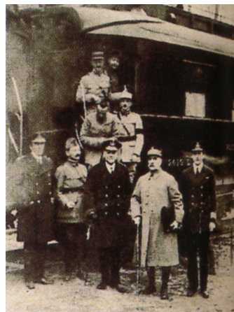
图 31. 贡比涅森林：福煦与德国签订停战协定后在福煦车厢前留影

就这么简单的十二个字，成为了协约国军队战场态势的一道分水岭！由此，赶紧辅以其他来源的情报和分析，法国