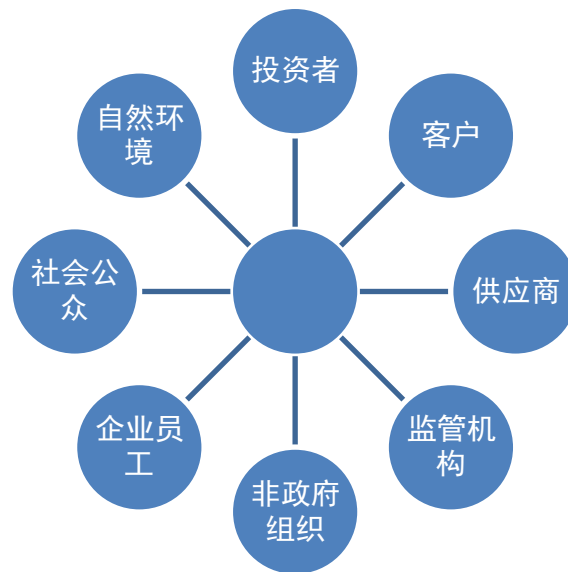
图表：公司主要利益相关方分析

多年来形成的经营维度、社会维度以及环境维度，公司的利益相关方主要由投资者、客户、供应商、监管机构、非政府组织、企业员工、社会公众、自然环境八类群体构成。