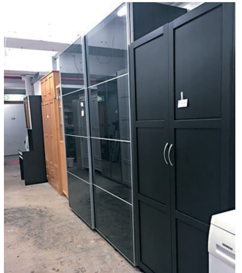
■ 二手傢俬店「Happyshop」有各種材質、樣式的衣櫃可供選擇。