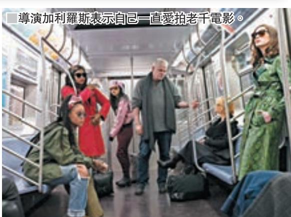
導演加利羅斯表示自己一直愛拍老千電影。