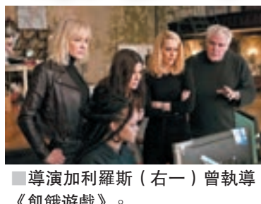
導演加利羅斯(右一)曾執導《飢餓遊戲》。