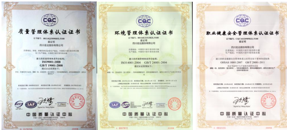
ISO14001/ OHSAS18001/ ISO9001 证书