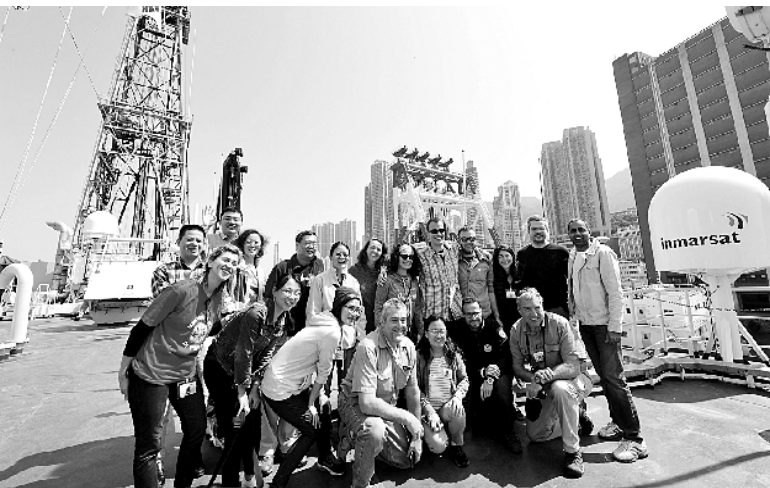
2月13日,中外科学家在“决心”号上合影