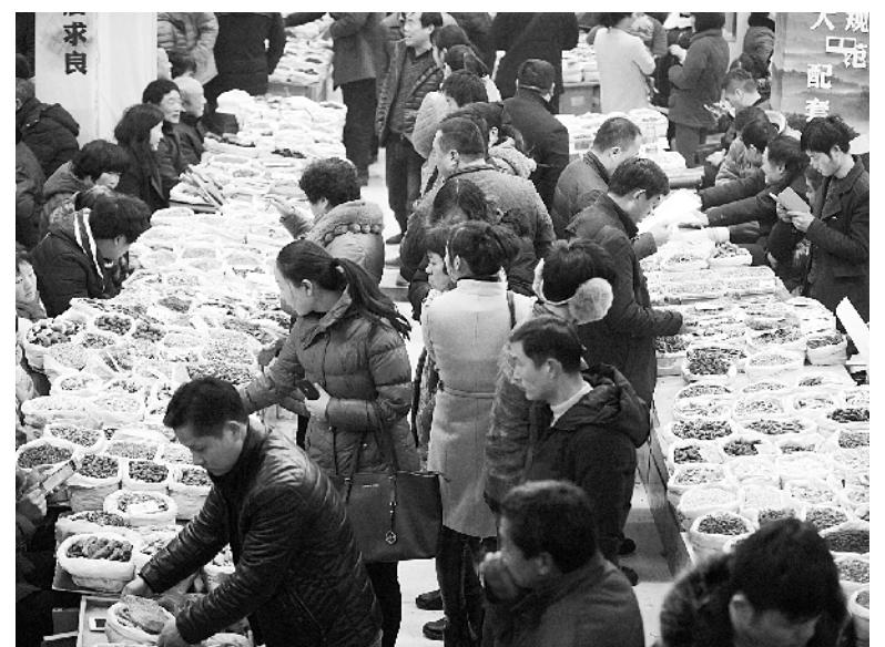
2月14日,中国亳州农历鸡年药市在康美华佗国际药城正式开市。亳州中药材交易市场是国内上市品种最多、交易最为活跃的中药材专业交易市场之一,2016年交易额达243亿元