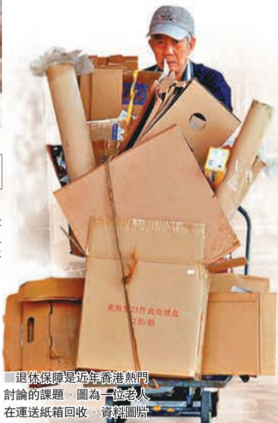
退休保障是近年香港熱門討論的課題。圖為一位老人在運送紙箱回收。資料圖片

不過，亦有人指出，雖然延後退休年齡會導致長者佔據高位的時間增加，影響年輕人的晉升，但換個角度去想，年輕人工作的時間也延長了，代表他們日後亦有同樣長的時間身居高位，因此等於沒有特別影響，而且晉升機會不是依靠長者退休，而是個人能力。