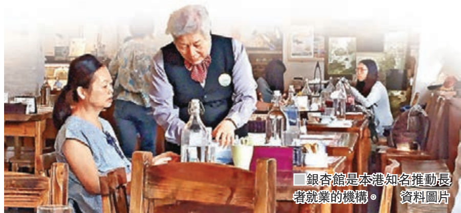
銀杏館是本港知名推動長者就業的機構。

在香港，同樣亦有不少長者希望繼續工作，其中最著名的就是2003年成立的銀杏館。銀杏館是一間推動長者就業的機構，旨在為有需要的長者提供工作機會，經營餐館、長者樂隊等業務，一方面讓他們維持經濟獨立，另一方面則讓他們感到自己的存在價值，助其重拾自信及尊嚴。