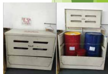
化學廢物存放地方的例子