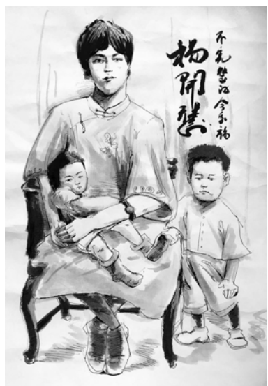
杨开慧与两个儿子合影的绘图。

从毛泽东旧居陈列馆、中共中央上海局机关旧址、中国劳动组合书记部旧址,到中共四大纪念馆、李达故居暨人民出版社旧社平民女校旧址等沪上红色文化遗址,同学们先后前往19个一级红色景点进行深度参观、访谈,试图用自己的手绘作品,记录下那个战火纷飞的年代里革命先辈心中的理想与追求,描绘参观走访过程中让他们感动至深的细节。