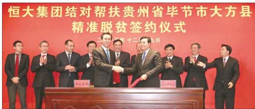
2015年12月,恒大帮扶大方精准脱贫签约仪式现场。

在这场“决战乌蒙之巅”的扶贫工作中,恒大用行动书写自己的决心。马不停蹄地成立了扶贫办后,许家印宣布无偿投入30亿,并选派了第一批专职扶贫团队常驻大方县,展开脱贫攻坚战,确定实施