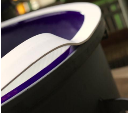
<GORE® 带状密封垫片 Series1000>在搪玻璃法兰上的应用

根据需求裁切安装，这意味着无需额外场外定制大型垫片，从而省去了漫长交货期和复杂的运输、搬运和安装过程。采用< GORE® 带状密封垫片 Series 1000>，还可以缩减密封垫片库存，降低库存成本。