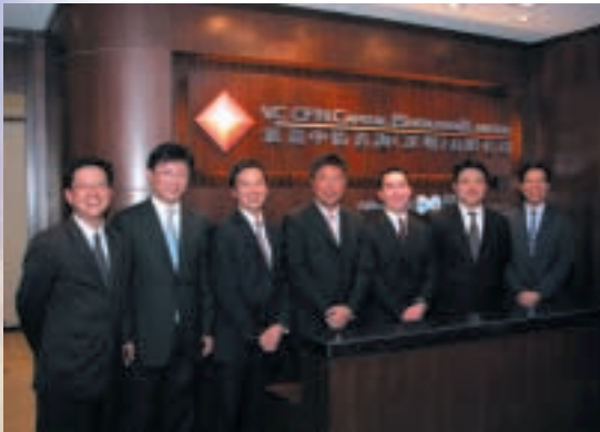
滙盈加怡金融集團之高級管理層人員出席深圳辦事處之開幕典禮。

非典型肺炎疫情於二零零三年上半年對市場投資氣氛及本集團之經紀業務造成不利影響，然而，自二零零三年六月開始非典型肺炎退卻後，股票市場氣氛漸見復甦。例如，恆生指數自二零零三年六月起攀升約31%至二零零三年十二月底之12,575點。與此同時，香港股票市場(包括創業板)每日平均市場成交量，由截至二零零三年六月三十日止六個月約71億港元增加至截至二零零三年十二月三十一日止六個月約136億港元。由於股票市場之交投量上升，本集團之投資銀行及金融服務業亦因而受惠，並取得重大改善。經紀及期貨業務於二零零三年十二月三十一日止六個月期間之總營業額，較二零零三年二月五日至二零零三年六月三十日期間增加約230%，於二零零三年下半年更錄得溢利。此外，截至二零零三年十二月三十一日止六個月經紀業務之每日營業額，比對二零零三年二月五日至二零零三年六月三十日期間錄得增長超過160%之卓越表現。