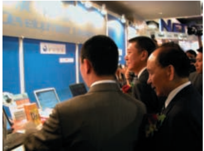
澳門特別行政區行政長官何厚鏞先生參觀本集團在澳門資訊週2003設置之攤位。

在收購事項完成後，本集團繼續全力支持科技業務之研究及開發工作，以擴大其產品種類及提升其交易解決方案軟件；由於不斷提升軟件；以及其所提供