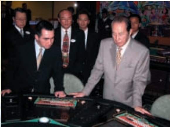
何博士於澳門皇都酒店中的摩卡角子娛樂坊開幕禮上，研究由御想經銷之嶄新高科技電子輪盤。

本集團於二零零四年三月宣佈，將購入在澳門出租博彩機及向承租人提供有關管理服務的摩卡角子集團有限公司的80%權益。本集團亦宣佈進行一項集團重組計劃，根據該計劃，科技業務將由新濠集團直接擁有。有關交易須得到獨立股東批准，並在得到批准後將於二零零四年五月完成。本人深信，由於收購摩卡角子集團有限公司帶來的理想業務增長及盈利潛力，有關交易將有利於本集團；而重組科技業務更可精簡滙盈的業務並讓滙盈專注於其投資銀行及金融服務業務。