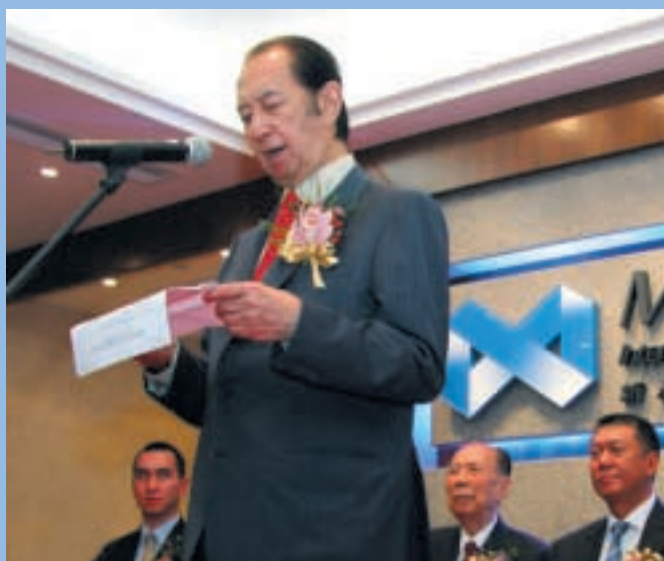
何博士主持本集團澳門總部之開幕禮，出席者包括澳門特別行政區行政長官何厚鏞先生及全國政協副主席馬萬祺先生。