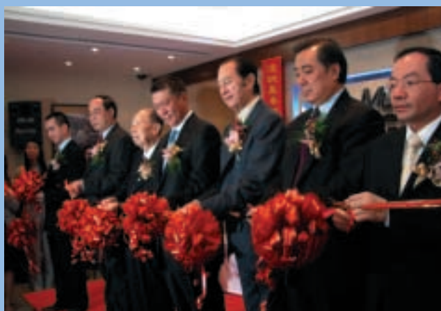
中央政府駐澳門特別行政區聯絡辦公室李勇武副主任，中華人民共和國外交部駐澳門特別行政區前任副特派員吳紅波先生，澳門特別行政區運輸工務司司長歐文龍先生及其他嘉賓於本集團澳門總部開幕禮上參與剪綵儀式。

除了金融服務業務之外，本集團的科技業務亦成功取得顯著改善。本集團於香港的資訊科技部門－亞洲網上交易於二零零三年繼續成功招攬多個優秀的新客戶，而部份產品，如外匯交易系統並取得更高的市場佔有率。本集團於澳門的資訊科技部門－御想亦已成為著名的資訊科技外判商及角子博彩機的資訊科技專家。