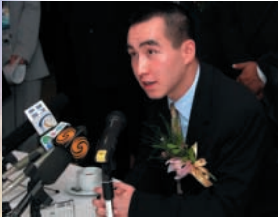
新濠集團董事總經理何猷龍先生出席本集團澳門總部開幕典禮的記者招待會。

於二零零三年，本集團業務成功邁向另一個新里程，透過收購滙盈控股有限公司（前稱亞洲網上交易科技有限公司）（「滙盈」）（於香港聯合交易所有限公司創業板上市之公司）之67.57%權益（「收購事項」），將集團業務拓展至投資銀行及金融服務及科技業方面。