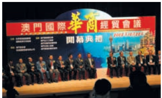
滙盈加怡金融集團贊助澳門國際華商經貿會議2003。

本集團於二零零三年二月五日完成收購滙盈，並拓展其業務範疇，其中包括開始為地區及國際性客戶於香港及海外證券交易所、資本市場提供廣泛的投資銀行及金融服務，以及提供企業融資顧問服務。收購事項為本公司之一項關連及須予披露交易，並已取得獨立股東之批准。有關收購事項之詳情分別於本公司於二零零二年十月十二日及二零零二年十一月十六日刊發之公佈及通函內提述。