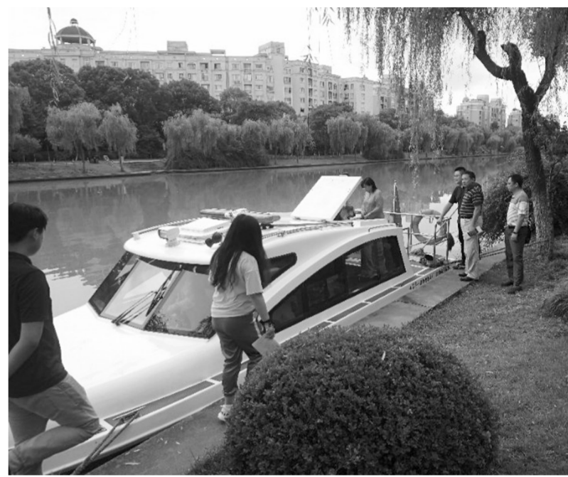
污染源普查检查组一行前往检查入河排污口。