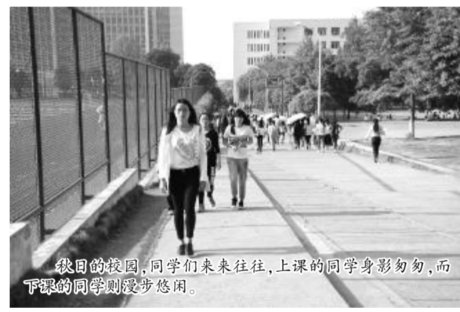
绿茵的校园,同学们来来往往,上课的同学身影匆匆,而下课的同学则漫步悠闲。