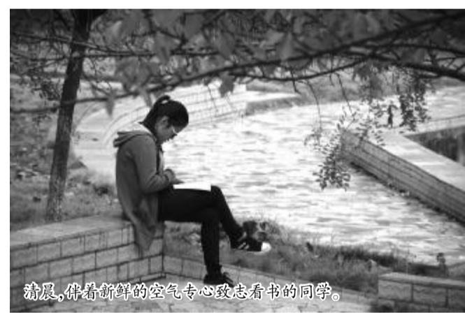
清晨,伴着新鲜的空气专心致志看书的同学。