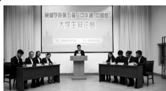
唇枪舌战,比赛现场十分激烈,同学们在台下看得聚精会神。