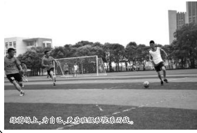
绿茵场上,动自己,更为班级荣誉而战。