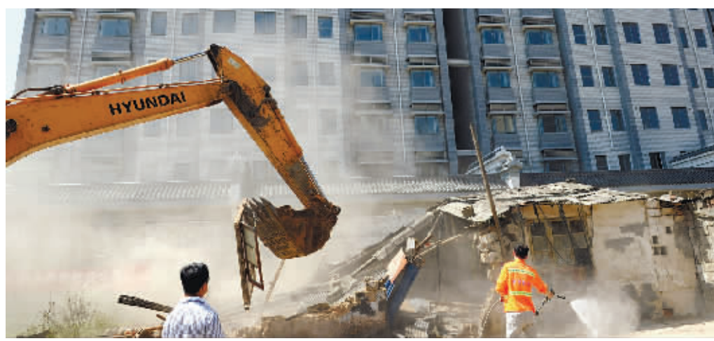
7月11日，长沙汽车西站迎春路的“马路仓库”被集中拆除。